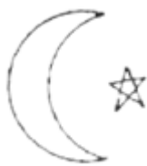
Diana i Lucyfer

feministyczny i moda preferujący ubiór jednakowy dla kobiet i mężczyzn - popierają tezy New Age.