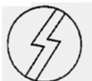
S "złamane" - błyskawica

Znak oświeconych, którzy nazywają siebie również: "Nosicielami światła" lub "Wysłannikami Lucyfera". Nawiązuje do masońskiego "boga uniwersalnego".