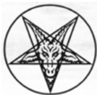
Bafomet (gwiazda głowy kozła)

W XIX wieku znany okultysta i kabalista Eliphas Levi, wprowadził podział pentagramów na "dobre i złe". Pierwszy z nich (rysunek z lewej) posiada jeden wierzchołek skierowany ku górze i jest często przedstawiany z wpisaniem w siebie wizerunkiem człowieka. Pentagram ten jest jednym z ważniejszych symboli masonerii i bywa interpretowany jako symbol człowieka (ADAM-EVE), będącego w drodze do "odrodzenia" i "ubóstwienia" - jest to więc symbol pogańskiego humanizmu inicjacyjnego. W niektórych przypadkach znak ten jest także uznawany jako symbol "dobrego" Lucyfera. Z kolei odwrócony pentagram z dwoma wierzchołkami skierowanymi ku górze (rysunek z prawej) jest uważany za symbol "złego" Szatana (SAMAEL-LILITH), przedstawionego w postaci tzw. "kozła z Mendes" (Baphometa). Przejście z jednej formy pentagramu, w drugą można uzyskać poprzez jego obrót o 33 stopnie, zaś liczba 33 ma podstawowe znaczenie w symbolice masońskiej - między innymi wiąże się ona z ilością stopni wtajemniczenia w niektórych obrządkach masońskich. Pentagram wykorzystywany był i jest w symbolice masonerii okultystycznej, magii ceremonialnej i kabalistyce oraz jako symbol komunizmu - znak gwiazdy pięcioramiennej został przedłożony bolszewikom przez Lewę Trockiego-Bronsteina, członka loży masońskiej Wielki Wschód, który zdawał sobie sprawę z jej ezoterycznego sensu. Symbol ten jest też często wykorzystywany przez zespoły rockowe, na okładkach ich płyt, w grach komputerowych, jak i w filmach.