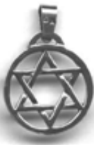
Gwiazda sześcioramienna – heksagram

Symbol mający pochodzenie starożytne. Występował w Indiach i u Celtów - jako znak słońca i ognia. Później przedstawiał cztery wiatry, cztery pory roku i cztery kierunki świata. Obecnie ramiona tego "złamanego krzyża" zostały przesunięte w przeciwnym kierunku, by przedstawić elementy lub siły zwracające się przeciwko naturze i harmonii. Symbol ten jest używany przez grupy neonazistowskie i okultystyczne.