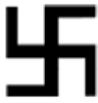
Swastyka (złamany krzyż)