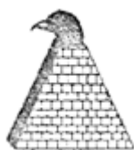
Piramida z głową sokoła

Bogini księżycy - Diana i gwiazda poranna, Lucyfer. Istnieją prawie we wszystkich typach czarów i satanizmu. Pewna wersja tego symbolu charakterystyczna jest głównie dla satanizmu. Także znak islamu.