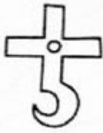
Krzyż zamętu, krzyż szatański

Jest to symbol starożytny podważający ważność chrześcijaństwa i boskości Boga, z czasem zapożyczony przez satanistów. Interpretacja jego nie jest jednoznaczna. Jedni uważają, że chrześcijaństwo kończy się pomieszaniem, poplątaniem, stąd okrąg - symbol doskonałości jest niedokończony z lewej strony. Inni dostrzegają tutaj dwa elementy: krzyż i znak zapytania. Całość należy więc utożsamiać z następującą treścią: "Czy Jezus rzeczywiście umarł za nasze grzechy?" Korzeni tego stwierdzenia trzeba szukać w podaniu w wątpliwość Prawdy, ze znanej sceny biblijnej opisującej szatana w postaci węża wypowiadającego wątpliwość w stosunku do Boga (por. Rdz 3, 1 A wąż był najbardziej przebiegły ze wszystkich zwierząt polnych, które Jahwe Bóg stworzył. On to rzekł do niewiasty: "Czy to prawda, że Bóg powiedział: Nie jedzcie owoców ze wszystkich drzew tego ogrodu?")